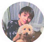
Much Justin マック ジャスティン